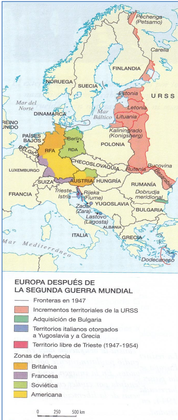
Mapa D : Mapa de Europa después de la Segunda Guerra Mundial.

El Mapa D muestra claramente con diversos colores la situación Europea después de la Segunda Guerra Mundial. Se observa con trazados de líneas negra las fronteras luego de 1947. Con un color rojo claro, se simboliza a los territorios anexados por la URSS entre ellos Estonia Letonia y Lituania. Con color verde la Adquisición de Bulgaria. Con color azul se simboliza los territorios Italianos otorgados a Yugoslavia y Grecia. De color rojo intenso se observa al territorio Libre de Trieste, fue una Ciudad estado situada en Europa central, entre el norte de Italia y el territorio de Eslovenia y Croacia. Fue establecido en 1947 por la Resolución 16 del Consejo de Seguridad de las Naciones Unidas. También se observa en el mapa D, las zonas de influencias Británica, Francesa Soviética y Americana, simbolizadas con colores anaranjados, morado, verde claro y amarillo respectivamente.